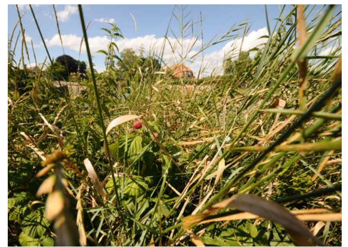
Passage des Castors, près du cimetière, deux carrés ont été aménagés au printemps. Les plantes y foisonnent en liberté.